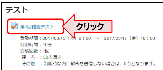
【コースのトップページ画面】

受験回数、受験期間、制限時間が設定されているときは 受験回数、小テスト公開・終了日時 制限時間が表示されます