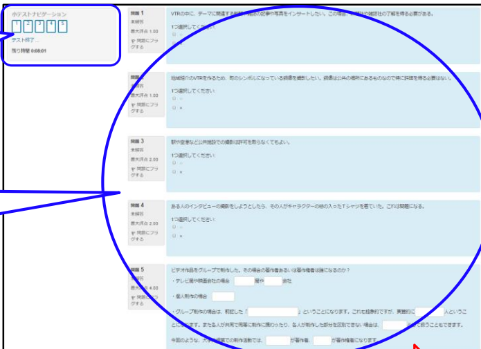
【小テスト受験画面】