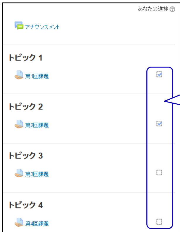
【学生のトップページ画面】

完了条件を満たした項目に“✓”が入力されます ※ 完了トラッキングを設定していない項目にはチェックボックスは表示されません